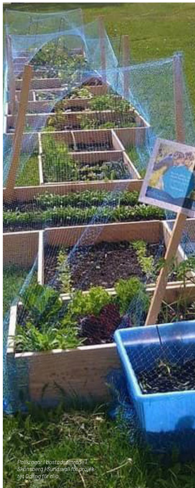
Pallkragar i bostadsområde i Skönsberg i Sundsvall för projektet Odling för alla.

tets deltagare kunde arbeta med lera i form av keramik, skulptera och dreja, måla i akvarell, akryl och olja samt skapa i olika bildtekniker som perspektiv och porträtt. Man kunde också göra eget papper, prova enklare bokbinderi och nåltovning. Vi nådde ett 30-tal unika deltagare varav flertalet återkom varje vecka. Många fortsatte skapa hos oss även utanför projektet.